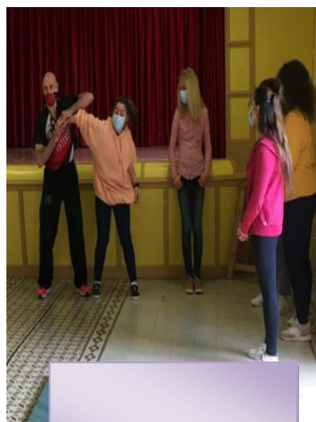
DEFENSA PERSOAL PARA VÍTIMAS